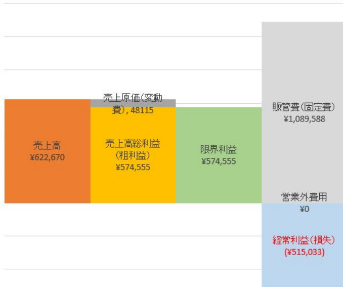
損益計算書(期首～当月)

ただし売上(オレンジ)に対して固定費(グレイ)が多くかかっており、毎月の固定費は次のように推移しています。